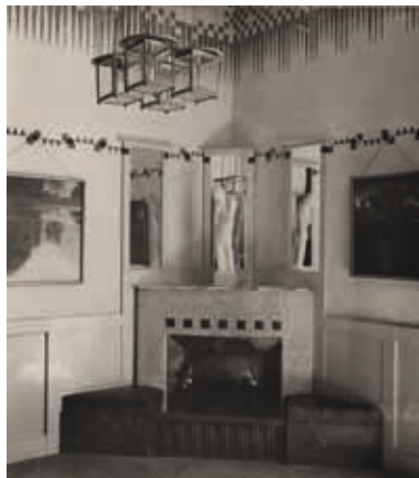
Das »Herrenzimmer« in der Villa Waerndorfer, um 1902, MAK, Wien

1912 wechselt das Gemälde auf Verkaufsvermittlung der Wiener Galerie Miethke um 3.000 Kronen den Besitzer. Ein stolzer Marktpreis in einer Zeit, in der z.B. das Jahresgehalt eines Volksschullehrers rund 1.500 Kronen betrug. Nach mehreren Eigentümerwechseln erwirbt Rudolf Leopold 1976 das Gemälde unter dem Titel »Stiller Weiher«. Seit Eröffnung des Leopold Museum im Jahr 2001 ist das Bild eine Ikone des Hauses und reist immer wieder zu zahlreichen internationalen Ausstellungen, u.a. mehrmals nach Japan, nach Moskau, Dresden, Rotterdam, Zürich, Liverpool, Paris oder Venedig. Nun, im Sommer 2013, ist es am Attersee zu sehen.