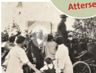
Gustav Klimt mit Pferdekutsche auf der Fahrt zum Bahnhof nach Vöcklabruck, im Hintergrund die Pfarrkirche von Seewalchen, 1913

14.07.2013 Nostalgie- Dampflokomotive-Fahrt an den Attersee